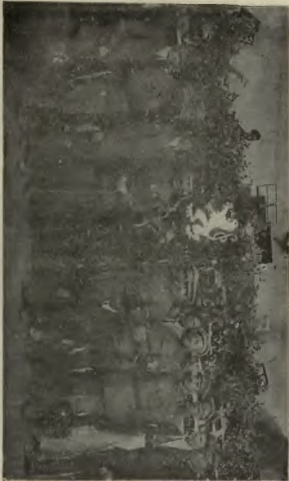
Представители союзников в Ожскъ черезъ день послѣ сверженія большевиковъ.