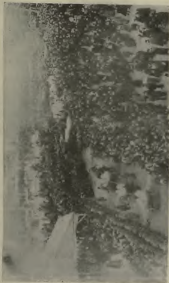
Похороны жертв большевиков.