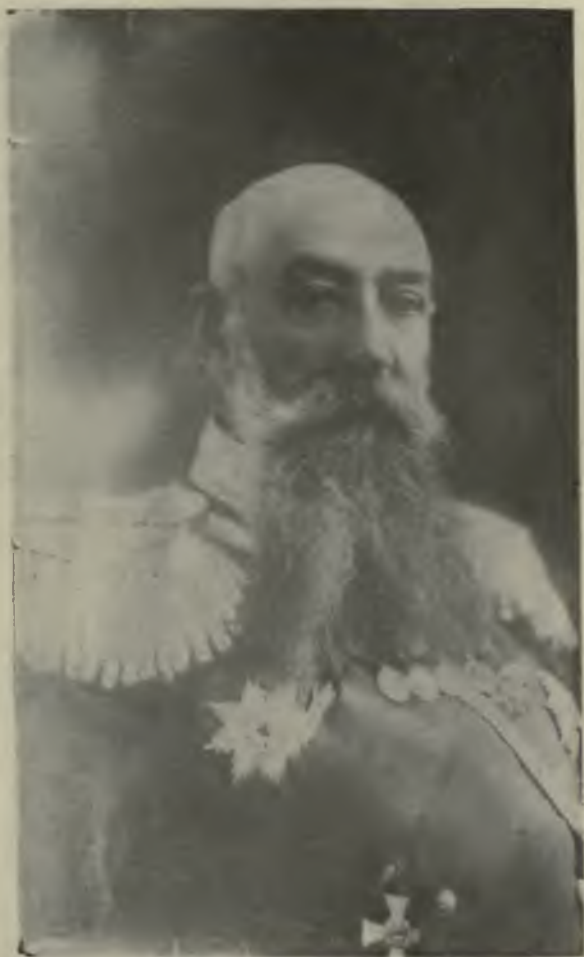
Генералъ Д. Л. Хорватъ.