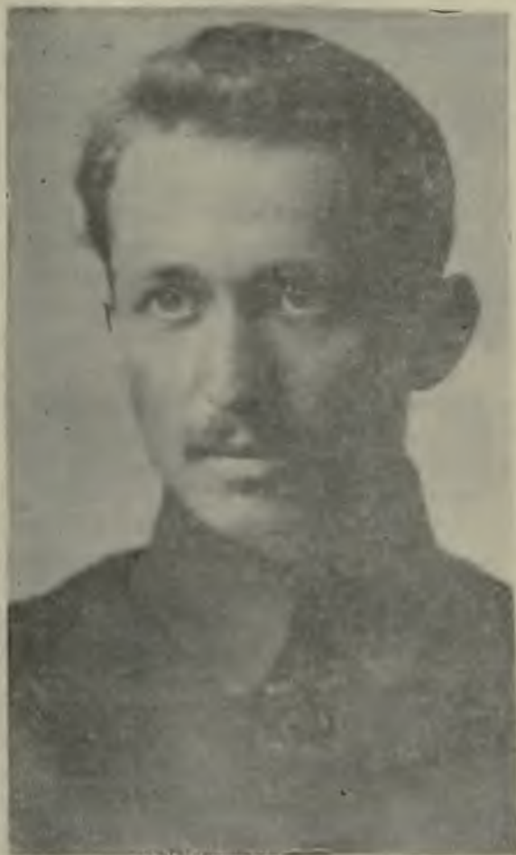
Министръ финансовъ И. А. Михайловъ.