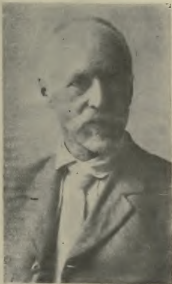
Министръ народнаго просвѣщенія Р. Р. Сапожниковъ.