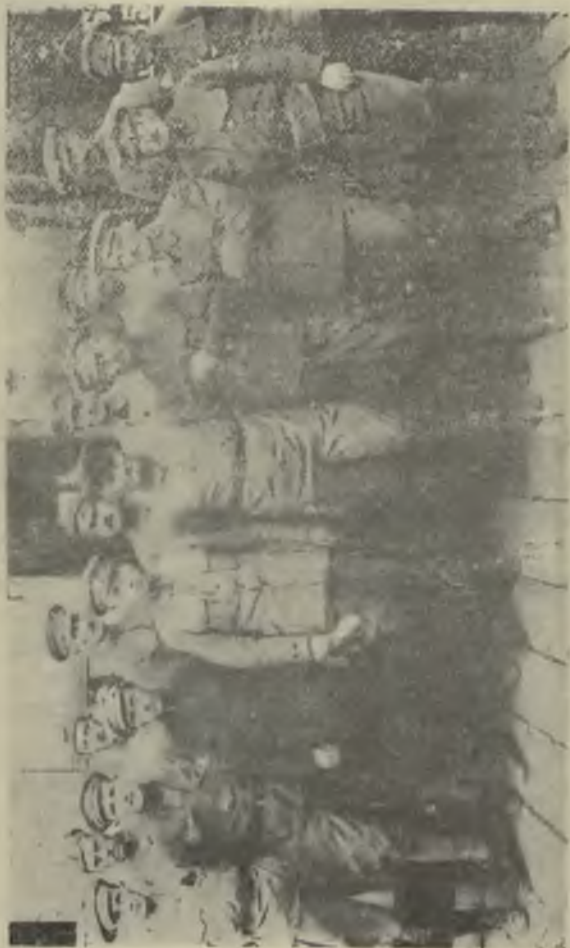
Чешский съездъ въ Омскѣ въ июль 1918 г.