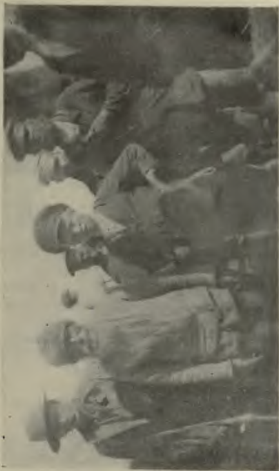
Большевики ли они?