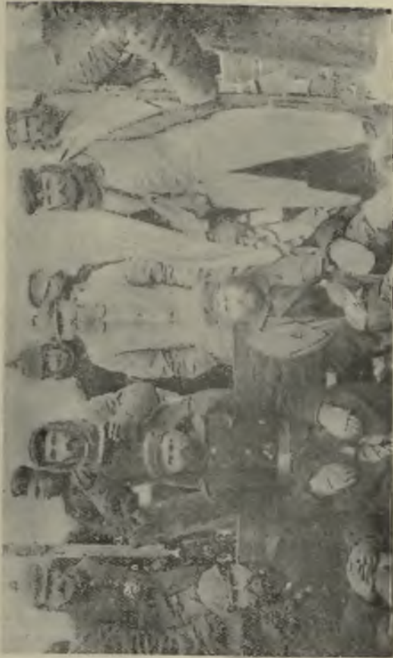
Восползанные в Сибири.