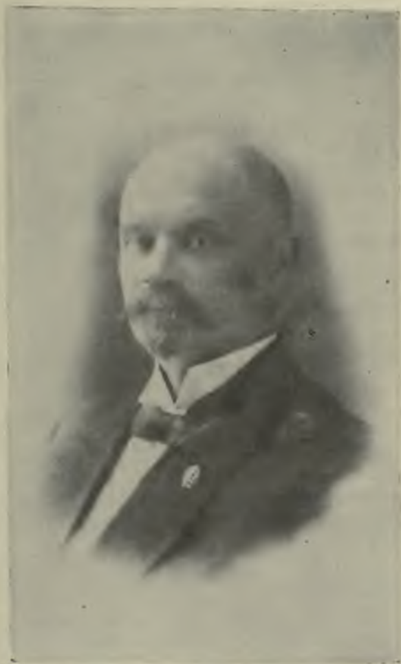
Председатель Совѣта министровъ П. В. Вологодскій.