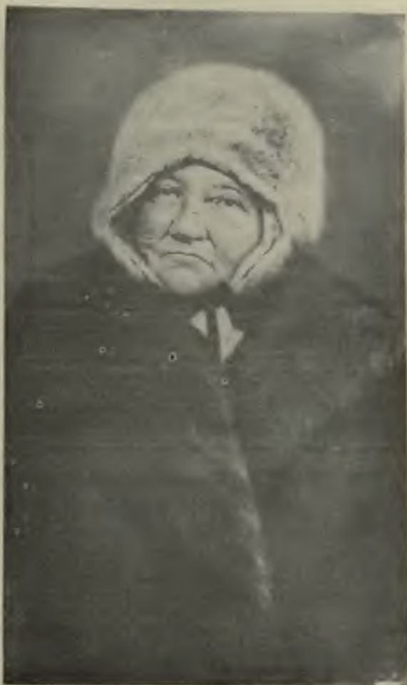
„Бабушка русской революции“, Е. Н. Брешко-Бужковская.