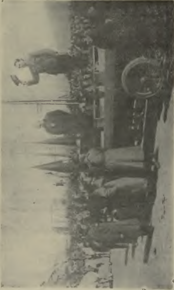
Манифестація въ честьъ большевиковъ во Владивостокѣ.