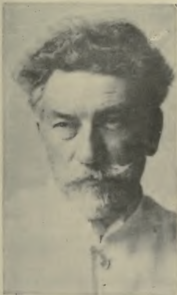
Управляющій министерствомъ путей сообщенія Г. М. Степаненко.