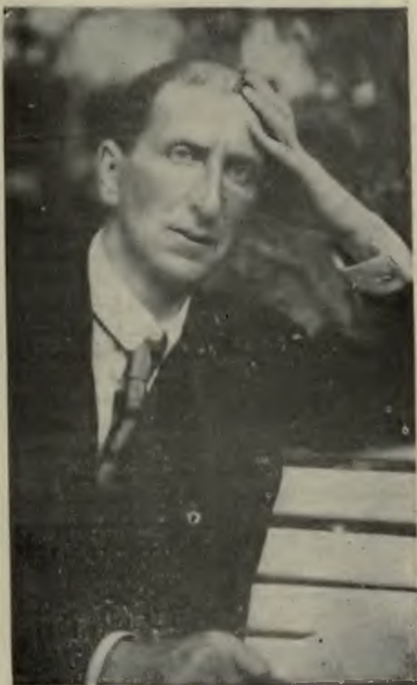
Министръ юстиці Г. Б. Патушинскій.