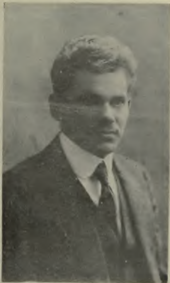
Министръ земледѣлія Н. И. Петровъ.