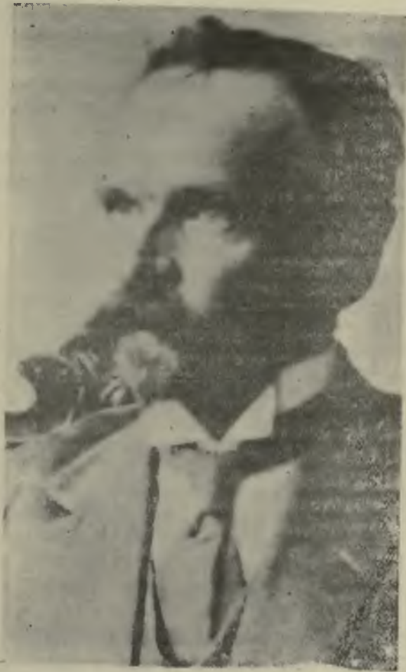
Министръ груга Л. И. Шумиловскій.