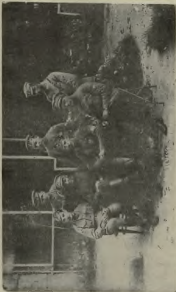
Генералъ Гайда со штабомъ.