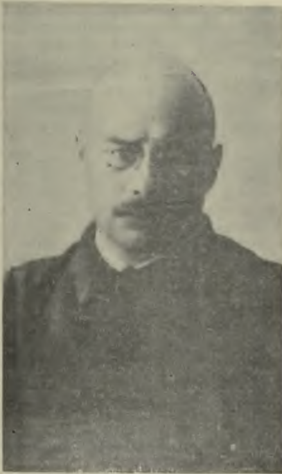
Министръ снабженія И. И. Серебренниковъ.