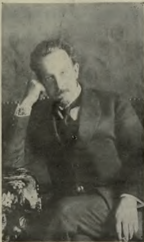
Председатель Директоріи Н. Д. Авксентьевъ.