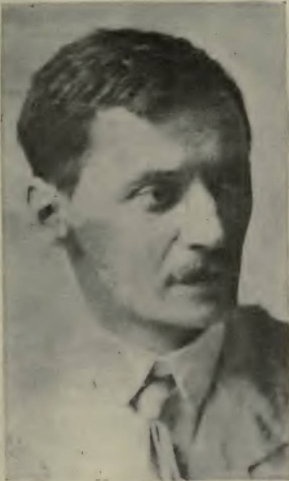
Министръ торговли и промышленности П. П. Гудковъ.