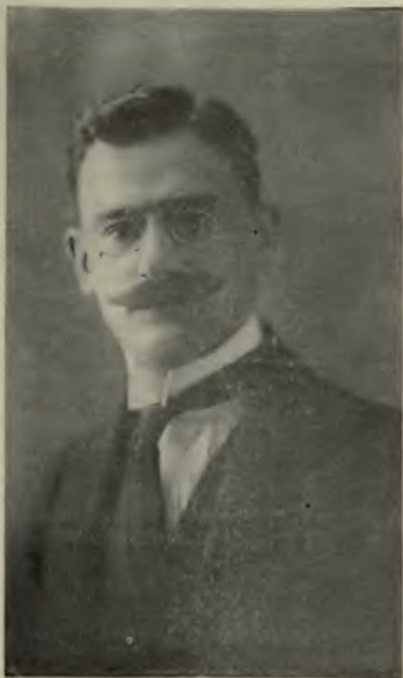
Управляющій Дѣлами Правительства Г. К. Гинцевъ.