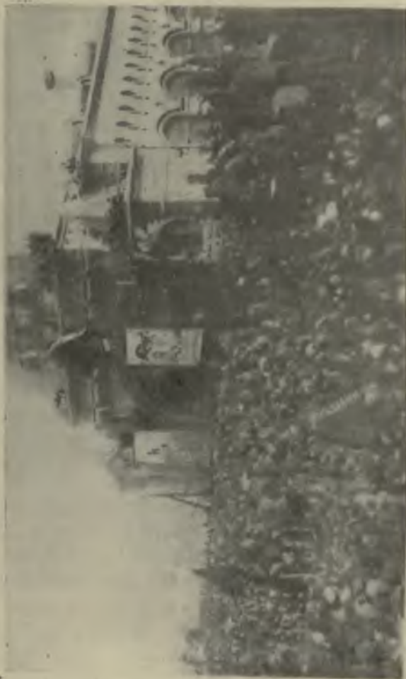
Почесний той Жестувіть.