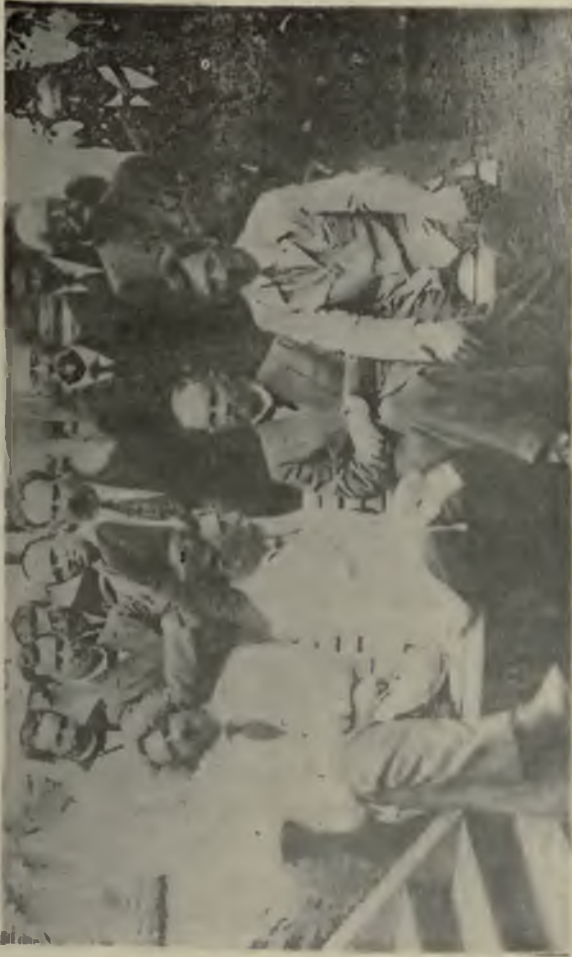
Сибирское Правительство (группа).