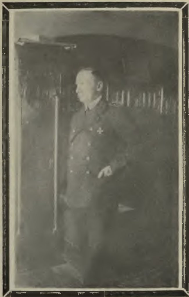
Верховный Правитель Адмиралъ А. В. Колчакъ.